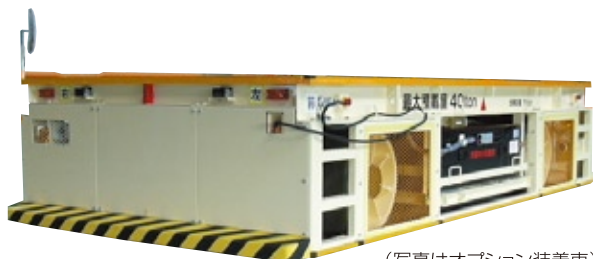
(写真はオプション装着車)